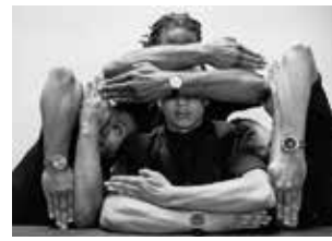
GÉOMÉTRIE VARIABLE

En octobre, préparez une chorégraphie pour la Block Party du lendemain (voir ci-dessous) ! Amateurs, familles et danseurs, choisissez un binôme et travaillez avec les danseurs du projet Géométrie Variable .