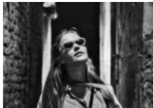
ALIA © DR

Chaque 1 er mercredi du mois, le FLOW vous invite à monter sur son toit pour une soirée hip-hop, au son des bons vinyles et d'une performance graff.