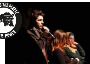
MC METIS