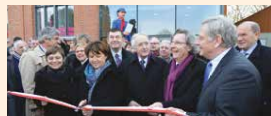
INAUGURATION DE LA BOURSE DU TRAVAIL 2012