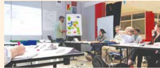
PROJET DE TIERS-LIEU 1 er comité de pilotage avec tous les partenaires - 28 mai 2015