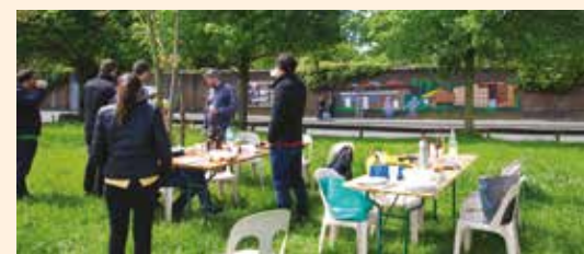
FÊTE DE L'EUROPE 9 mai 2015