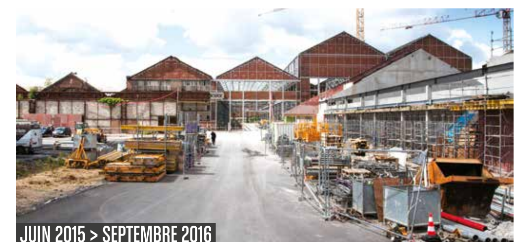
JUIN 2015 > SEPTEMBRE 2016

Le site Fives Cail, datant de 1861, nécessite des travaux réguliers afin d'être maintenu en bon état.