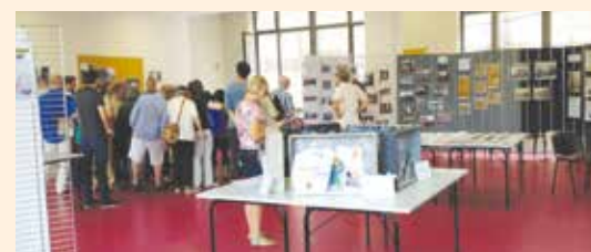
JOURNÉES DU PATRIMOINE 2014