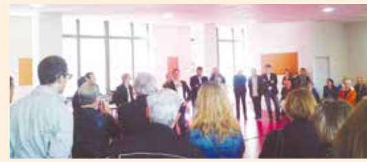
RÉUNION INFO CHANTIER 30 mai 2015