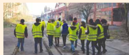
PARTENARIAT AVEC LE COLLÈGE BORIS VIAN depuis 2012