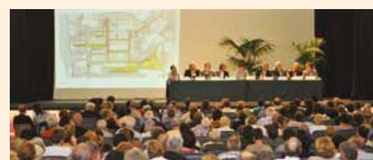
RÉUNION PUBLIQUE 2010