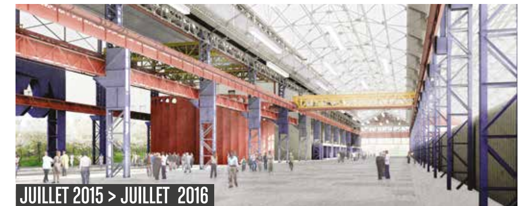
JUILLET 2015 > JUILLET 2016

Afin de récolter les eaux pluviales tombant sur les toitures des halles et notamment du lycée, une cuve de 9 mètres de haut va être installée à côté du passage couvert, dans la halle F8 réhabilitée.