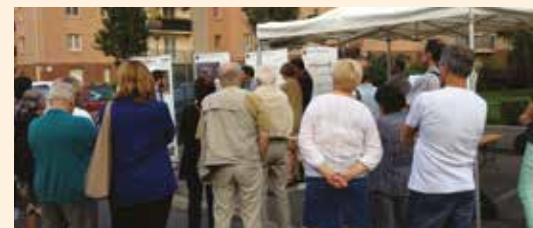
ATELIER RIVERAIN "VOIE NOUVELLE" 18 septembre 2014