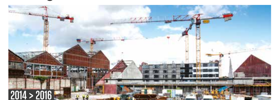
2014 > 2016

Les travaux du lycée hôtelier ont démarré en juin 2014. Il a d'abord fallu déconstruire et réhabiliter les halles dans son emprise.