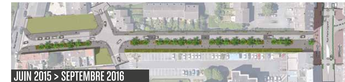
JUIN 2015 > SEPTEMBRE 2016

Afin de relier directement le site Fives Cail au métro Marbrerie, et ainsi privilégier les mobilités douces et l'intermodalité, une nouvelle voie en sens unique avec bande cyclable, connectant le parvis du lycée à la rue P. Legrand va être réalisée.